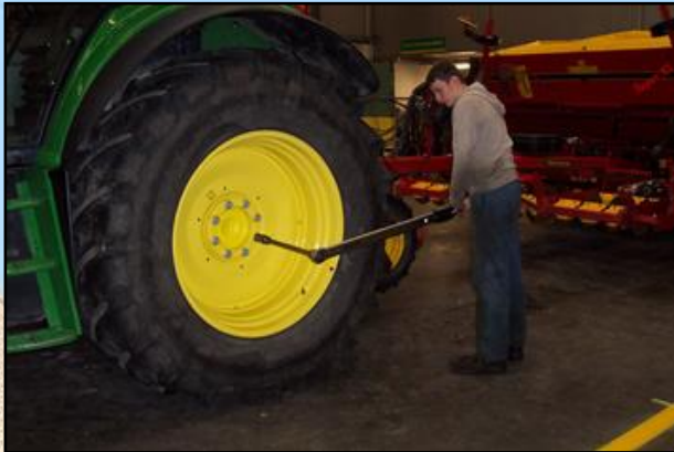
Land- und Baumaschinenschlosser/in

Blumenthalstr.40 – 39576 Stendal – Tel.: 0 39 31 / 25 18 3 - 104 – E-mail: produktives.lernen@sks-stendal.bildung-lsa.de